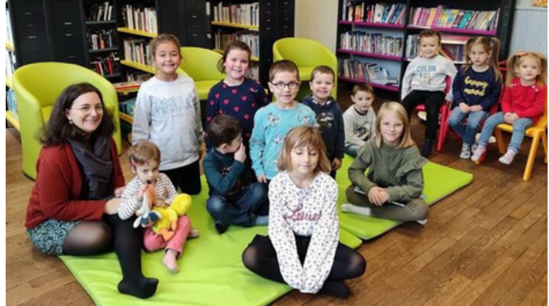
11 enfants présents à l'heure du conte pour écouter l'histoire "le fantôme rigolo". (Un Halloween étrange et amusant.).