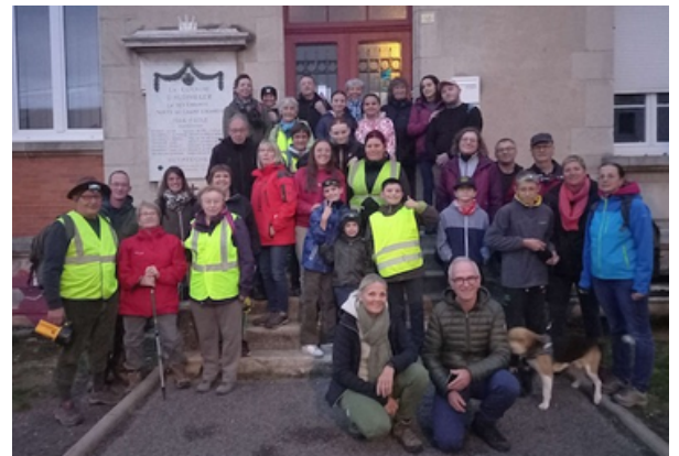
43 personnes se sont retrouvées autour d'un repas festif pour fêter l'arrivée du Beaujolais Nouveau.

Au programme, lecture, quiz, jeu de vocabulaire et compréhension d'une histoire en Lorrain